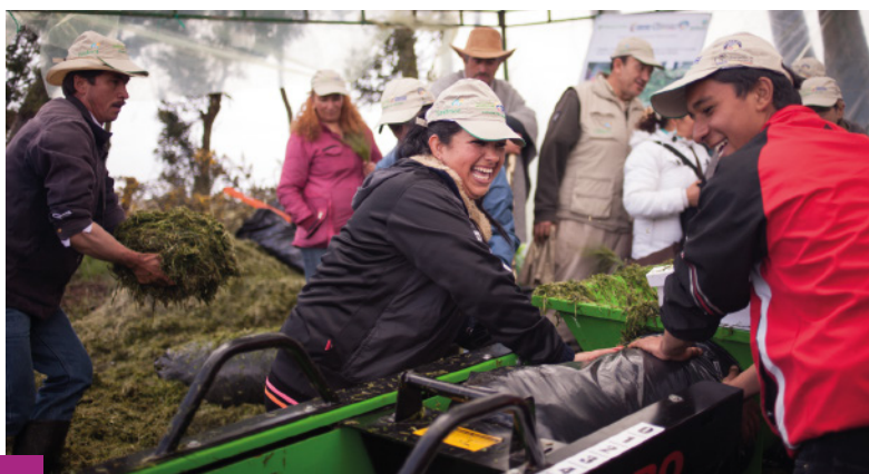
Día de Campo - Práctica de ensilaje - ASPOCAS

Hasta el momento se han realizado 19 días de campo con la participación de 713 personas.