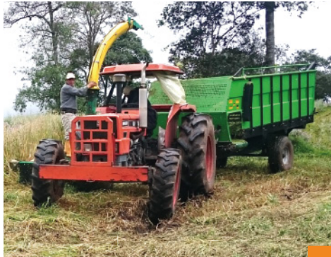
Cosechadora y Remolque forrajeros

10 remolques forrajeros hidráulicos, de ocho mt cúbicos y capacidad de carga de 4 toneladas.