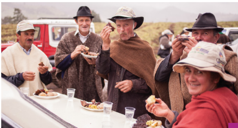
Día de Campo - Integración - COOPROLAG