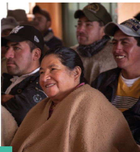
Capacitación en Levante de Terneras - ASOCHARQUIRA

¡Asistiendo a las distintas capacitaciones y poniendo en práctica los conocimientos adquiridos en Buenas Prácticas Ganaderas, aseguramos el futuro de nuestro negocio y la prosperidad de nuestra familia!