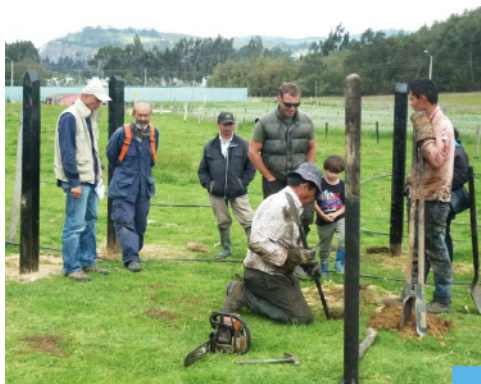
Asistencia técnica para construcción de brete - COMILES

Se construirán 40 bretes (uno en cada OG) con el fin de que los beneficiarios aprendan el proceso, y recibirán un plano detallado del mismo.