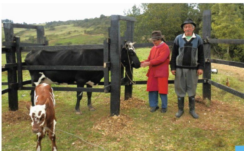
Asistencia técnica para construcción de brete - HATO RHUR