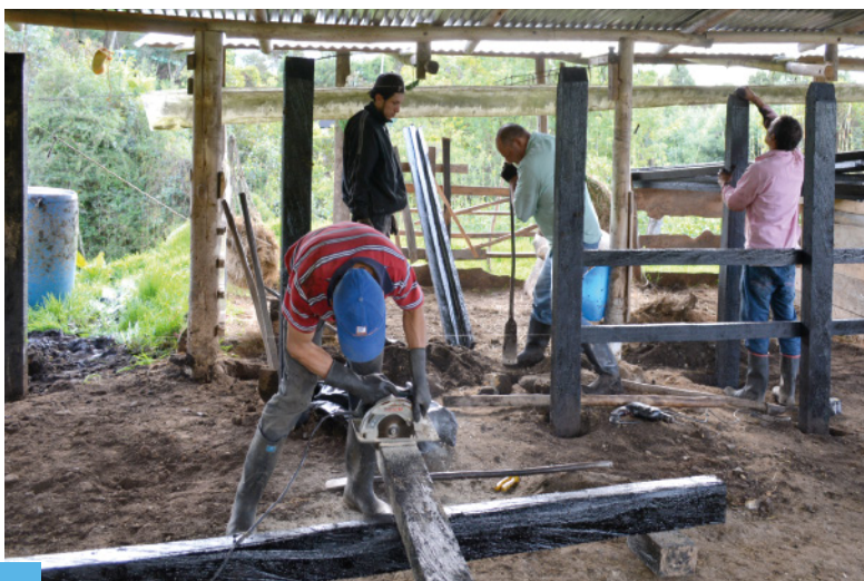
Asistencia técnica para construcción de brete - COOUNIÓN