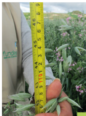
Pradera Comunal Renovada - COOPALAC

En el marco del convenio se establecieron 600 hectáreas en praderas renovadas (1 hectárea por beneficiario) y se sembraron 42 hectáreas en lotes comunales con las Organizaciones Ganaderas (OG), para aprender a cosechar forraje, con rendimientos de entre 30 y 50 toneladas de forraje por hectárea, por corte o pastoreo.