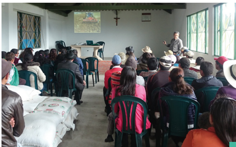
Capacitación en Renovación de Praderas - LEVACAR