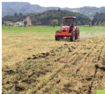
Descompactación de terreno

Como complemento, alrededor de la pradera se instaure una cerca viva con árboles (forrajeros, maderables) y se construye una cerca de protección para los árboles con postes y alambre liso. Esta cerca viva brinda sombra a los animales, sirve de barrera corta viento, restablece corredores arbóreos y mejora la fertilidad de la pradera, entre otras.