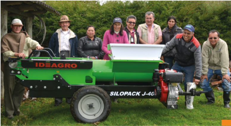
Entrega de Ensiladora - COAGROLAC

40 ensiladoras de bolsa tornillo sinfín; motor diésel 9,5 HP (2 Ton/ hora).