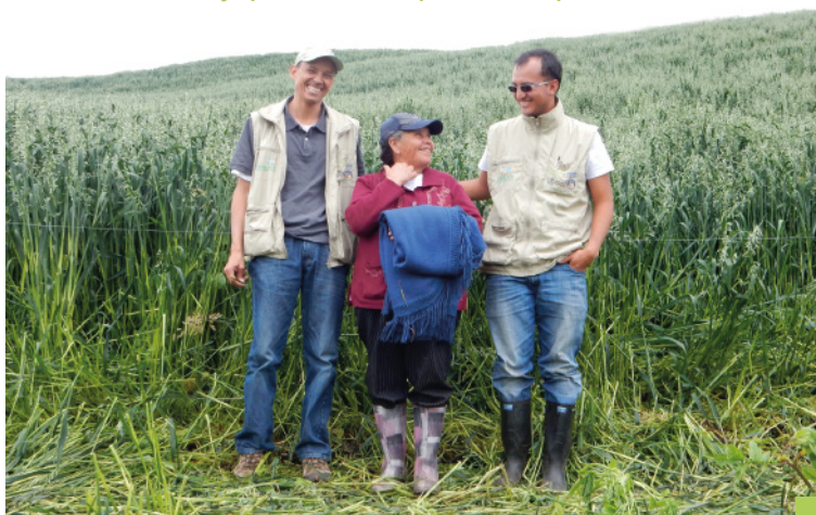
Pradera Renovada - AGROLACTE