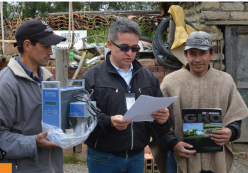
Entrega Equipos de Laboratorio Células Somáticas - APAMAP

17 laboratorios medidores de células somáticas.