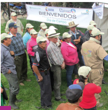
Día de Campo - Bienvenida - ASGANAPIUG

En agosto se iniciaron los días de campo: Jornadas de capacitación práctica con la presencia de los técnicos de Fundesot y los asociados de las Organizaciones Ganaderas (OG). A lo largo de este día se aprende a hacer silo, que es una forma de almacenar y conservar comida para los animales. También se aprende a manejar la maquinaria entregada a las OG: ensiladora, cosechadora de forraje y remolque.