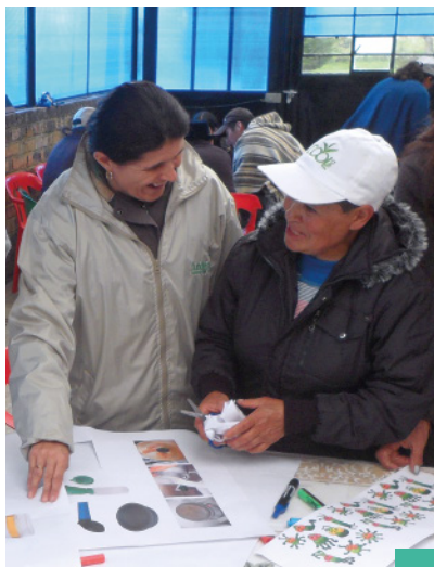
Capacitación en Calidad de Leche - COAGROLAC