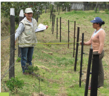
Construcción Cerca Viva - ASOCHINZAQUE