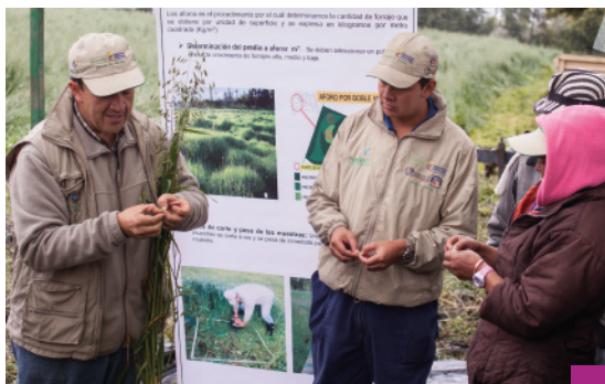
Día de Campo - Capacitación - COOPCORALES

Hasta el momento se han realizado 19 días de campo con la participación de 713 personas.