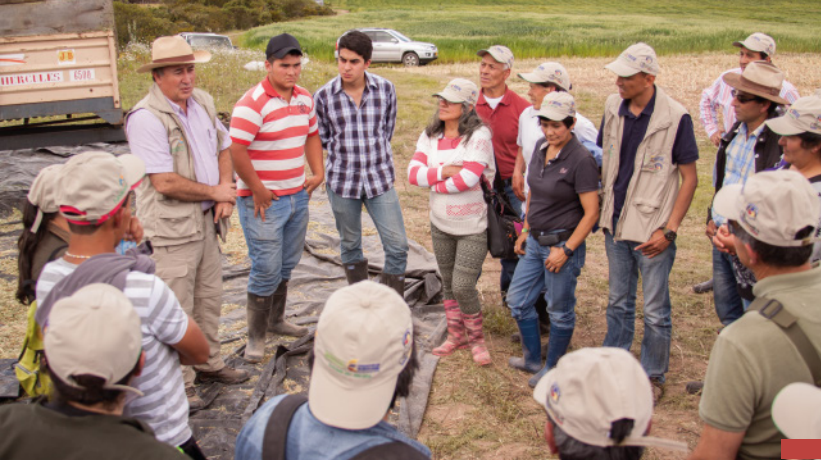
Día de Campo - COOLACTABIO

Dentro del componente de Asistencia Técnica y Buenas Prácticas Ganaderas-BPGs se realizaron Días de Campo para observar diferentes métodos de cosecha de forraje y elaboración de silo, alternativas de semiestabulación y suplementación para vacas de leche. En algunos lotes comunitarios de las OG se realizaron Demostraciones de Método con los asociados para la elaboración de silo con la silopack suministrada por el convenio. Se entregó a las OG las bolsas y melaza para la preparación del silo.