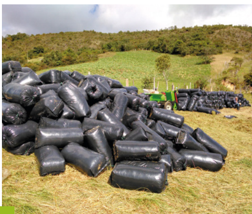
Aprovechamiento de Lote Renovado - COAGUASCALIENTES

Hasta el momento se han realizado 1074 Aforos de praderas, y se han enviado 200 muestras de forrajes al laboratorio para Análisis Bromatológico y Foliar.