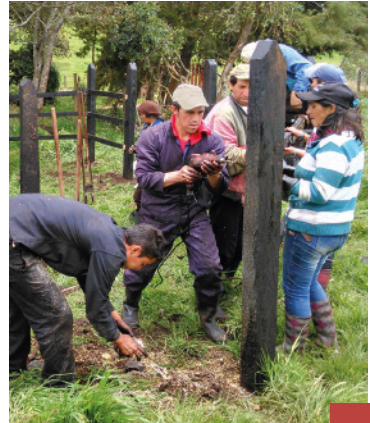
Demostración Método Brete - COOPCORALES