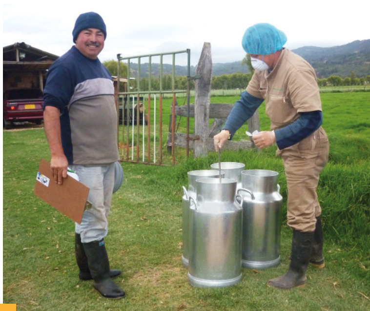
Toma Muestra de leche en finca de un asociado - APAF

Hasta septiembre 30 se han enviado al laboratorio 1331 muestras de leche para análisis. Los resultados permitirán hacer las recomendaciones y tomar las medidas pertinentes para continuar con el plan de mejoramiento de la calidad de leche en las 40 OG participantes.