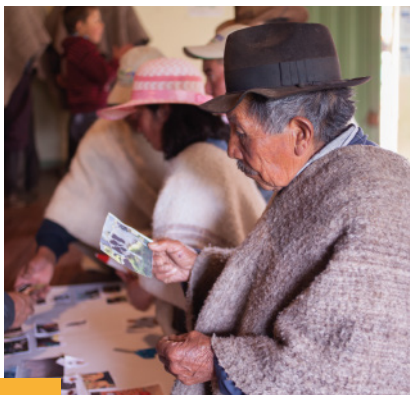
Capacitación Ordeñando Juntos - APAMAP

También se realizó la toma de muestras de leche en los centros de acopio de las OG y en las fincas de los asociados que proveen leche al centro de acopio. Las muestras son enviadas al laboratorio de CORPOICA ubicado en Tibaitata (Mosquera) para realizar un análisis de la calidad composicional e higiénica de la leche, y de células somáticas.