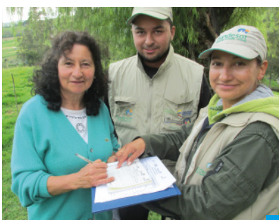
Registro y Firma del Diagnóstico realizado - AGROLACTE

Se han realizado 568 Diagnósticos Reproductivos en finca a 3500 animales; se han tomado 1454 muestras de sangre para hacer Perfiles Reproductivos y 1261 muestras para Perfiles Metabólicos.