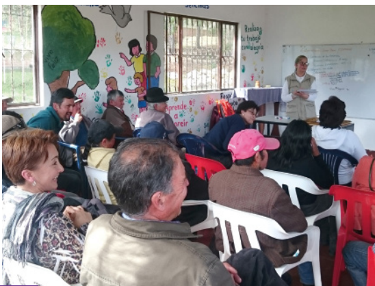
Empresarización Línea Base - COOPTOMINÉ