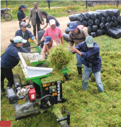
Demostración Método Ensilaje - COAGROLAC

En total han realizado 84 Días de Campo y Demostraciones de Método, con la participación de 2094 personas.