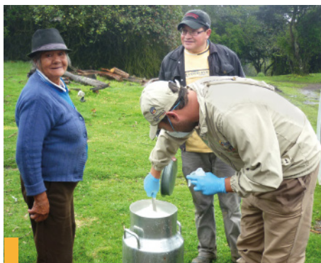
Toma Muestra de leche en finca de un asociado - HATO RHUR

Hasta septiembre 30 se han enviado al laboratorio 1331 muestras de leche para análisis. Los resultados permitirán hacer las recomendaciones y tomar las medidas pertinentes para continuar con el plan de mejoramiento de la calidad de leche en las 40 OG participantes.