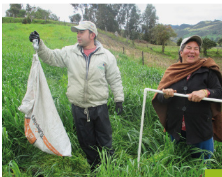
Aforo de pradera - ASOPROCAMPO

Se ha realizado seguimiento al desarrollo de los lotes de praderas renovadas, brindando asistencia técnica para su aprovechamiento. Una de las actividades fue la medición del desarrollo de las praderas mediante Aforos en el tiempo, así como muestreos de la calidad del forraje para Análisis Bromatológicos y Foliar.