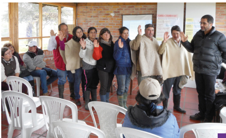
Empresarización Adecuación de Estatutos - AGROLACTE

Según los requerimientos, con algunas OG se han organizado talleres para la Adecuación de Estatutos, Asociatividad y Obligaciones Tributarias.