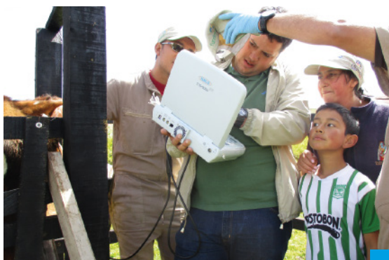
Diagnóstico Reproductivo - ASOLHATOGS

El Diagnóstico Reproductivo consiste en hacer un examen físico a la vaca para determinar el funcionamiento de su sistema reproductivo. Se realiza palpación rectal y con el apoyo de un ecógrafo se ve el estado del útero y los ovarios, y se establece si esta