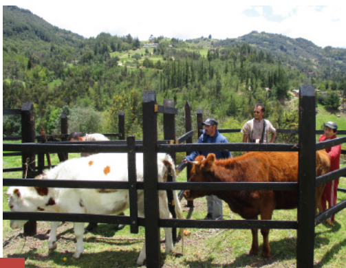
Brete finalizado - COMITÉ DE GANADEROS

Una vez seleccionados los beneficiarios de los bretes, se realizaron 27 Demostraciones de Método para aprender su proceso de construcción. En esta actividad participaron 351 personas. El convenio suministró los materiales, la mano de obra es aporte de los beneficiarios. A la fecha están construidos 400 bretes.